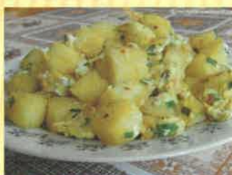
24. knedlíky s vajíčkem