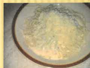
19. špagety se sýrovou omáčkou