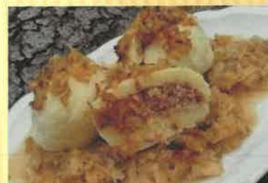
17. špekové knedlíky s cibulkou a zelím