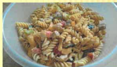
27. těstovinový salát s kuř.masem a zeleninou