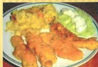
9. Rybí prsty, brambor