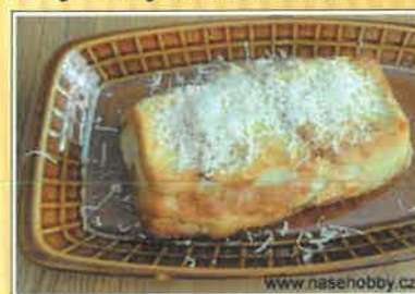
8. žemlovka s jablky a tvarohem