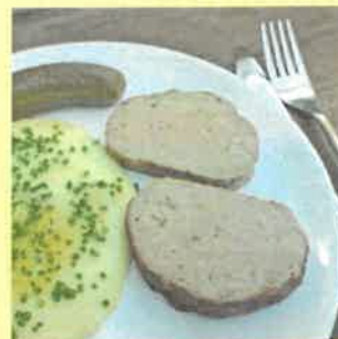
16. Masová sekaná s bramborovou kaší