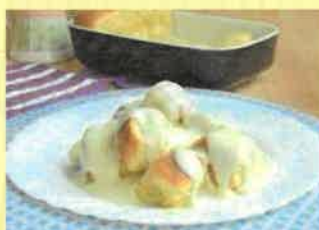
8. žemlovka s jablky a tvarohem