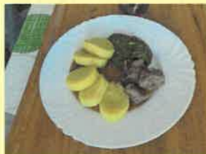
12. vepřová plec na česneku, špenát, bram.knedlík