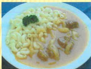
13. Vepřový guláš, těstovina