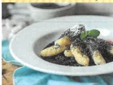
14. šišky s mákem