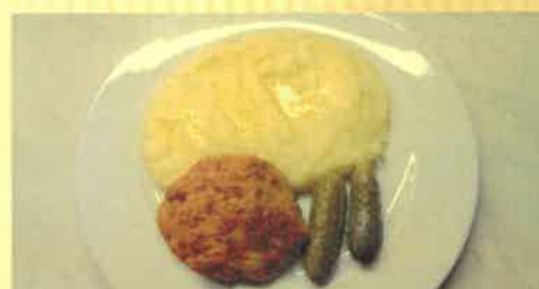
7. karbanátek s masem,bramborová kaše