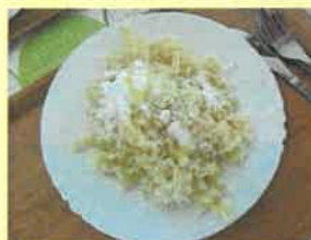
26. nudle s tvarohem