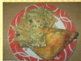
18. kuřecí stehno s těstovinami