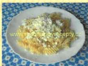
23. nudle s tvarohem