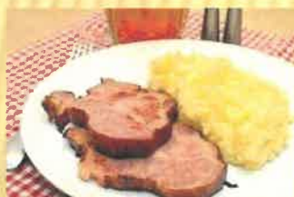
15. uzené maso s kaší