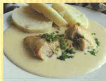
28. krůtí maso na smetaně