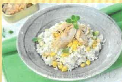
25. rýže s tuňákem