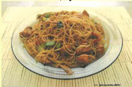
11. kuřecí čína, rýžové nudle