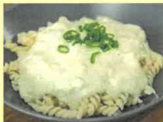
21. Nudličky se sýrovou omáčkou