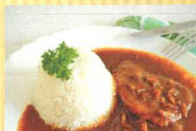
29. vepřová kýta na paprikách s rýží