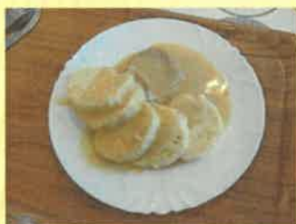
22. krůtí maso na smetaně, knedlík